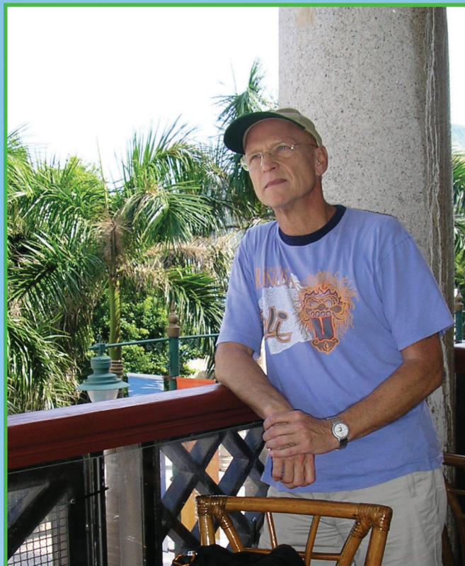
■ 憑欄遠眺，對前景抱有期望