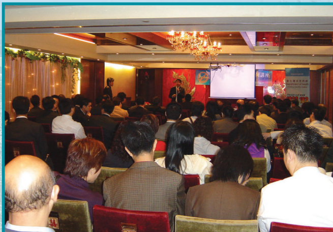
■ 食肆管理人正留心聆聽控煙辦公室人員的講解