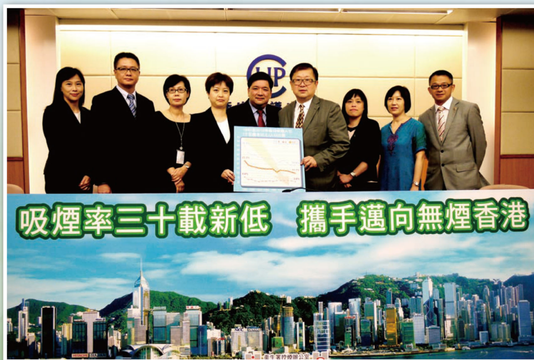
圖二 控煙辦公室主管何理明醫生（中）於2011年8月24日出席新聞發布會，講解香港最新吸煙情況，以及聯同各社區團體介紹不同的預防吸煙及戒煙服務

展望將來，政府會繼續投放資源，推動無煙文化，亦會繼續與社區不同的夥伴合作，同心協力締造『無煙香港』！