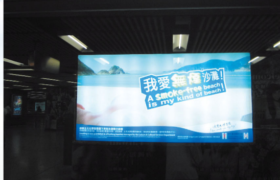
“我愛無煙沙灘”宣傳片和海報