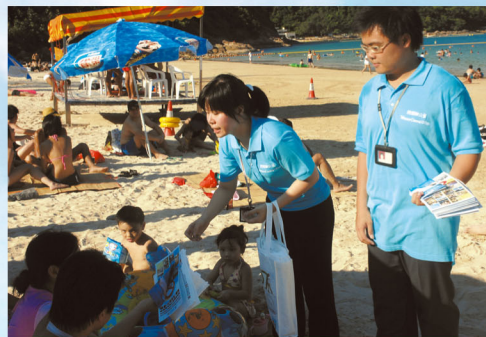
控煙督執在泳灘向市民派發禁煙單張

為提醒市民泳灘範圍內嚴禁吸煙，控煙辦公室由七月起展開了“我愛無煙沙灘”之宣傳活動，除了在電視、電台播放宣傳片和在泳灘廣播無煙訊息之外，控煙督察亦到了康文署轄下泳灘巡察，並向市民派發單張及精緻紀念品，以提醒市民有關泳灘的新禁煙規定。