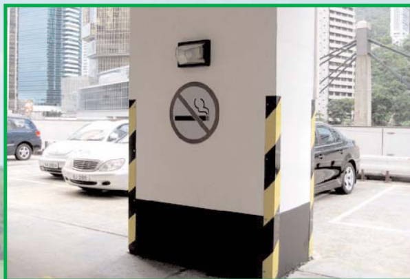
■ 商廈內的停車場也實施了無煙措施