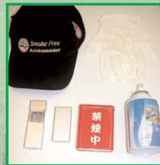
■ 巡查隊伍執行任務時的隨身裝備