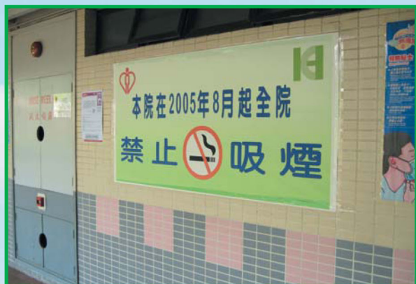
■ 院內張貼的巨型禁煙橫額

室內和室外範圍正式執行禁煙規定。管理層亦同意採取“一步到位”的方式，即不會設立吸煙區，以免產生混淆及失去禁煙的意義。