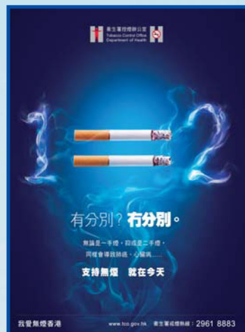
■ 衛生署有關二手煙禍害的宣傳海報

雖然科學界對二手煙禍害的研究比一手煙較遲起步，但大量科學證據在在都證實了二手煙與一手煙同樣會對健康構成嚴重的影響；再者，並沒有任何通風系統能完全消除二手煙對健康的威脅。因此，為保障大家的健康，貫徹室內全面禁煙是唯一可行的方法。