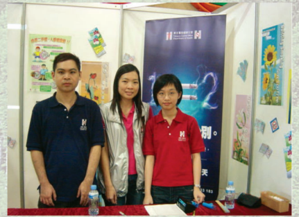
控煙辦公室員工於攤位內拍照留念