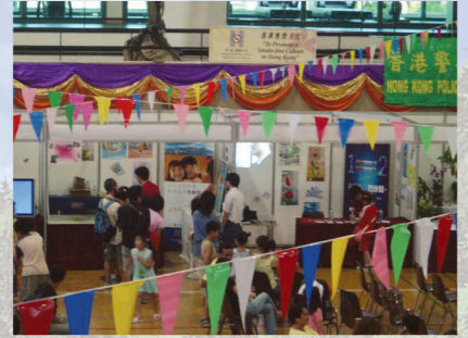
控煙辦公室負責的攤位

繼去年的成功經驗後，衛生署控煙辦公室今年再次獲香港警務處邀請參與「健康生活嘉年華」。是次活動於本年八月七日假旺角花園街警察俱樂部舉行，控煙辦公室負責一個以戒煙為主題的攤位。攤位內設有遊戲、宣傳影片播放、一氧化碳呼出量量度測試等。當日參加者人數眾多，反應熱烈。希望藉以下的圖片與讀者分享一下當天的喜悅。