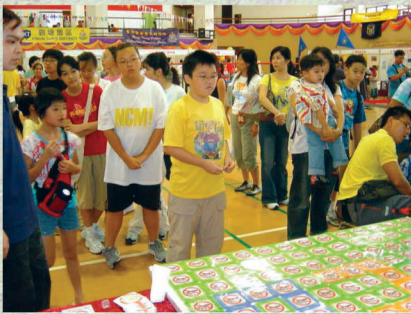
眾多來賓輪候參與攤位遊戲