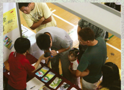
參加者對「一氧化碳呼出量」測試深感興趣