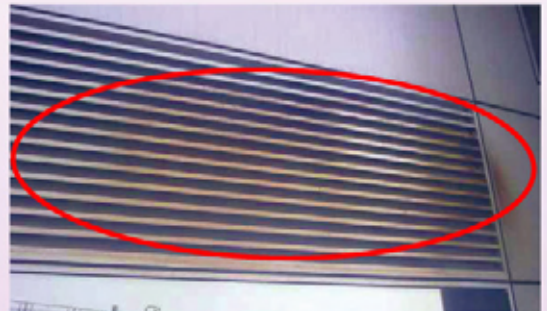
連接吸煙房內抽風機的排氣風口清楚可見點滿焦油（紅圈所示）