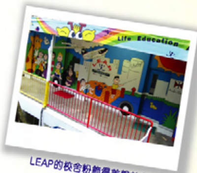
LEAP的校舍粉飾得美輪美奐

課程獨特之處是利用一輛特別設計的流動教學中心，將生活教育帶到校園裏。「流動教學中心」打破了傳統的課室框架，將它們的課程融入生動有趣的教材中。透過先進的影音器材、人體系統燈箱、會說話的腦袋和生活教育的「明星」長頸鹿哈樂和小馬凱莉等多元化的教材，讓學童明白健康生活的重要性及濫用藥物(包括煙草和酒精)的危險性。服務對象以小學至初中學生為主，教育幹事為不同級別的學生設計課程，以循序漸進的方式，加深學童對健康及濫藥的認識。