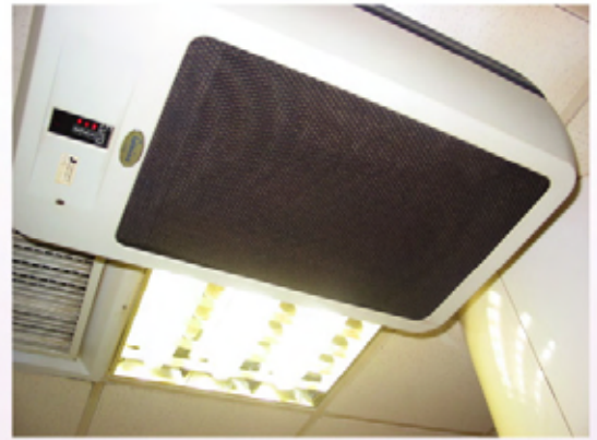
吸煙房內安裝的獨立抽風機

身為精明僱主或僱員的你，只要工作間實行全面禁煙，便可節省以上的種種開支，又可保障健康，提升工作效率和公司形象。相信大家也懂得如何選擇了，僱主僱員上下同心，齊來實施「無煙工作間」政策吧！