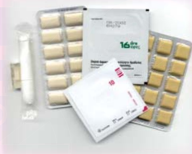
各款不同的尼古丁補充劑

上述戒煙服務的成績與外國的類似戒煙服務比較，是有過之而無不及。有這令人鼓舞的成績，各診所的醫護人員當然功不可沒。但最重要的是各戒煙者堅定的意志、與醫護人員合作無間，擺脫煙癮。