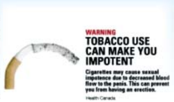
加拿大採用的其中一款健康忠告圖像

如患了癌症的肺部、出血的腦袋、受氣喘影響的嬰兒、焦黃的牙齒及萎縮的牙齦等圖片，以吸引更多人的注意，發揮更大的作用。加拿大煙包上原本的健康忠告只是白底黑字的字句及佔煙包35%的面積，而現行的健康忠告則以彩色圖樣顯示並佔煙包50%的面積，當中更提及戒煙“貼士”。