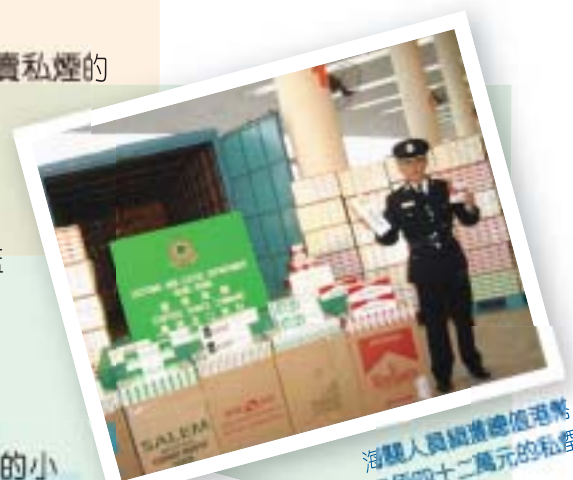
海關人員檢獲價值港幣 伍拾四十二萬元的私煙

其實要保障市民健康免受煙毒及二手煙的影響，及避免市民受騙而買下劣質貨品只有一個方法，就是拒絕吸煙。這樣不但會有健康的體魄，又可節省金錢。各位吸煙的朋友，不要再被煙草商及走私商人騙了，就在此刻立下決心開始戒煙。請致電 2961 8883，聯絡衛生署戒煙熱線吧！