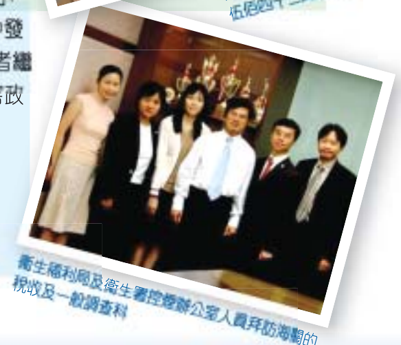
衛生福利處及衛生署控煙辦公室人員拜訪海關的 稅收及一般調查科