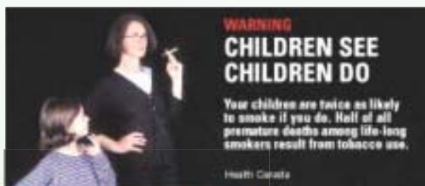
提示父母吸煙影響子女的煙包圖像忠告

煙草商普遍反對有關建議，全球第二大煙草生產商英美煙草公司(B.A.T) 提出並無任何實質數據顯示圖像健康忠告比文字健康忠告更能表達出吸煙的害處 (1) ，這些驚嚇的圖樣會令大眾受到一定的心理煩擾，反之可能會引起青少年的注意及興趣，嘗試去吸食第一支煙。另外，由於煙包的篇幅所限，並沒有足夠空間充份表達圖像含意，很容易令人誤會其背後意思。煙草公司認為這些規定面積的圖像健康忠告剝奪他們的知識產權。