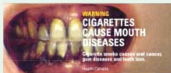
吸煙引致口腔疾病的圖像忠告