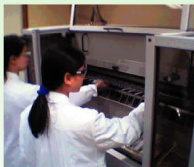
化驗員正在將煙仔放進「驗煙機」的吸咀上