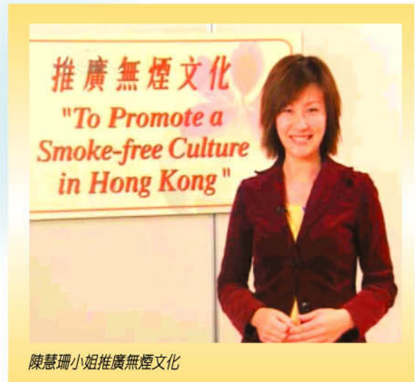
陳慧珊小姐推廣無煙文化

Flora 雖然是中國人，但卻擁有外國人般熱情，她形像正面而健康，笑容燦爛、自然、和藹可親。我們並沒有經驗如何聯絡一些演藝名人做宣傳，只是硬着頭皮試着幹，幾經轉折，終於取得 Flora 經理人鍾先生的聯絡電話。