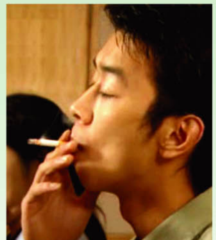
人們吸煙時的姿勢，手指夾著煙放在嘴邊，會遮蓋着煙仔上的小孔。

經過「改造」的煙仔，在人們真實吸煙的情況下，尼古丁及焦油含量都會高於 ISO驗煙方法的測試結果。事實上，無論含量多少，尼古丁及焦油都是致癌物質，對身體造成損害，故戒煙或拒絕吸煙才是最精明的做法。