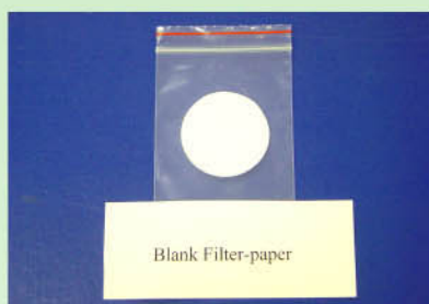
未經使用的過濾紙。

「驗煙機」的吸咀後面都裝有一張過濾紙，除了氣體之外，機器所吸入的焦油及尼古丁粒子都黏附在過濾紙上。透過分析過濾紙上的成分，化驗師便可鑑定煙仔的焦油及尼古丁含量。