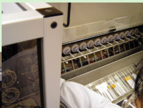
所有吸咀上都擺放妥當好煙仔後，「驗煙機」便會準備把煙仔燃點。