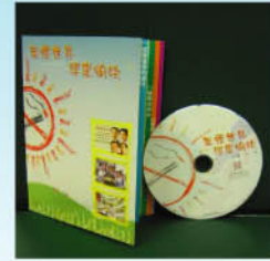
《無煙世界健康愉快》 影碟及教材