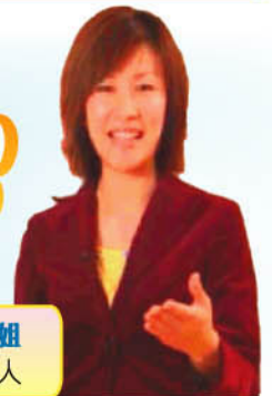
陳慧珊小姐 著名演藝人