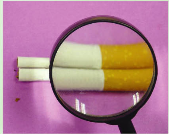
近鏡可見煙仔上的小孔。

大家可有留意有些煙仔的濾嘴旁邊穿了些小孔？有些煙仔的燃燒速度比較快？這些都是經過「改造」的煙仔！